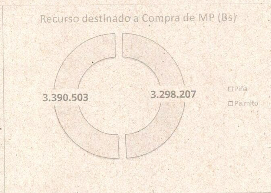
Figura 2: Recursos destinado para Palmito - Piña