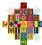
Ilustración 1: Estructura Organizacional Insumos Bolivia